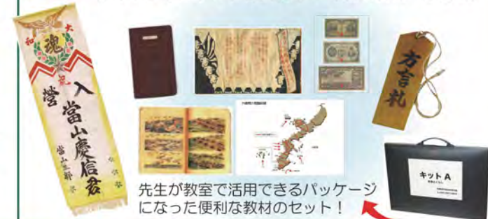
先生が教室で活用できるパッケージになった便利な教材のセット!