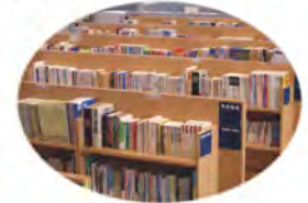
児童向け図書が約2200冊。60席あり、調べ学習等での活用も可能