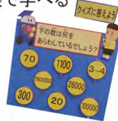
子ども目線で作成した展示パネルは、教材として活用できる