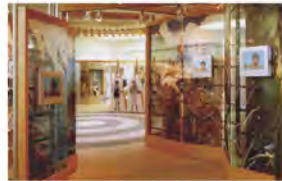
子ども・プロセス展示室