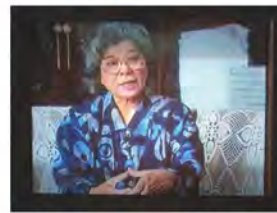
オジィやオバァの体験から、沖縄戦や戦争の悲惨さを学べる