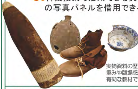
実物資料の歴史的重みや臨場感は、有効な教材である