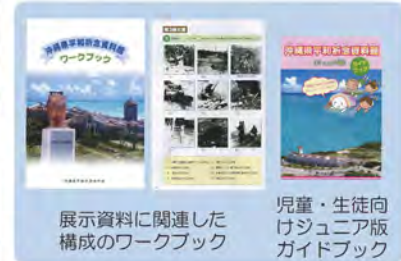
展示資料に関連した構成のワークブック