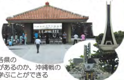
何故、各県の慰霊塔があるのか、沖縄戦の意味を学ぶことができる