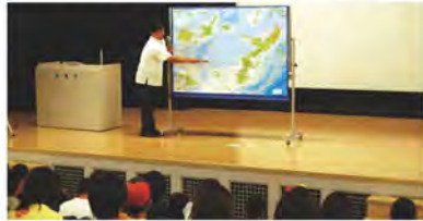
事前学習として有効で、展示を見るポイントが得られ、より理解が深まる