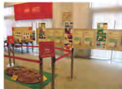
子ども・プロセス企画展の様子