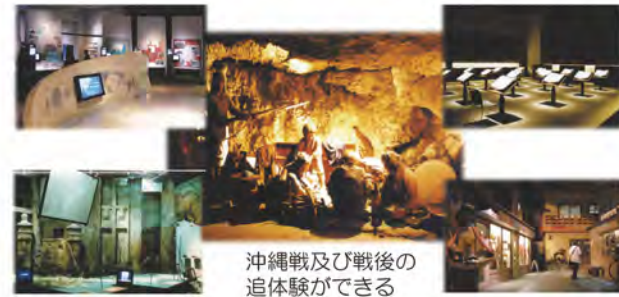
沖縄戦及び戦後の追体験ができる