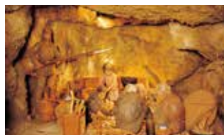
ガマの中に避難している住民、子どもの泣き声ももれないように口を押さえる母親、そして威嚇する日本兵

日本守備軍は首里決戦を避けて南部へ撤退し、出血持久作戦をとった。その後、米軍の強力な掃討戦により追いつめられ、軍民入り乱れた悲惨な戦場と化した。壕の中では、日本兵による住民虐殺や、強制による集団死、餓死があり、外では米軍による砲爆撃、火炎放射器などによる殺戮があってまさに阿鼻叫喚の地獄絵の世界であった。