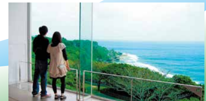
太平洋の大海原と打ち寄せる白波、青く広がる空の美しい景観にいやされる。