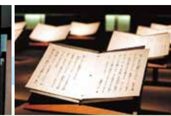
戦争体験の証言 145名(155件)の証言