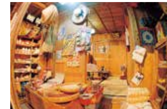
商店(マチャグラー)の内部

沖縄の戦後は収容所から始まった。その後、米・ソを軸とした冷戦構造の中で軍事基地として強化されていく沖縄。土地を奪われ、さまざまな抑圧を受けてきた住民の怒りは、島ぐるみの土地闘争や復帰運動へと広がっていく。東西冷戦が終わった今もなお、世界各地にくりひろげられる民衆の悲劇。沖縄の教訓は、「平和の要石」を通して世界へ発信される。