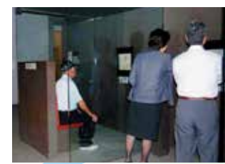
証言映像ブース 約1,000件の証言映像 (一部英語字幕対応)