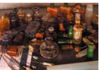
壕等から発見された医療器具

沖縄戦において、日米両軍は総力をあげて死闘をくり広げた。米軍は物量作戦によって空襲や艦砲射撃を無差別に加え、おびただしい数の砲弾を打ち込んだ。この『鉄の暴風』は、およそ3ヶ月に及び、沖縄の風景を一変させ、軍民20数万の死者を出す凄まじさであった。