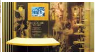
「いま、せかいで何が」のコーナーのひとつ、「なくならない貧困」。