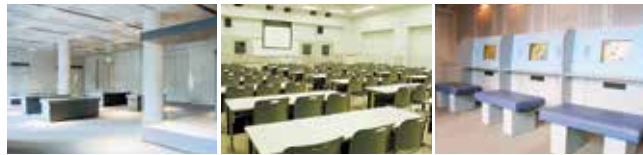
■企画展示室 (1階) 255㎡の広さで展示ケース、展示パネルを備えており、写真展や絵画展などにご利用になれます。 ■会議室 (2階) 教室形式で、100名程度収容できます。 ■クイズコーナー (1階) 利用者がモニター画面に触れ、沖縄に関するさまざまなクイズに答えます。