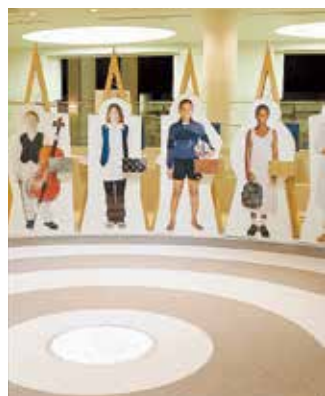
世界はひとつ! 18人の子どもたちが来館者を笑顔で迎えてくれる。

子ども・プロセス展示室は、大きく三つにわかれている。「ぬちどう宝・せかいの子どもたち!」は、さまざまな国の18人の子どもたちに学校のように、お友だち、遊びのこなどを聞くことができる。「いま、せかいで何が」は、なくならない戦争・紛争、いじめなどの人権問題、むしばまれる地球環境など、世界的な、あるいは、身近な問題を取り上げ、その原因、どうしたら解決できるのかなどを考えてもらうコーナーである。「わらびな-庭」は、展示物にふれながら、遊びを通して共通性を見出し、違いを認め合うきっかけづくりができる。親子や友人同士で平和について語り合える場がここにある。