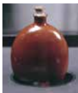
沖縄戦当時の水が入った水筒