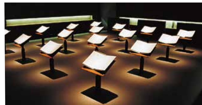
沖縄各地、疎開先、移民した国々での戦争体験証言の部屋。証言映像もご覧になれます。

沖縄戦の実相を語るとき、物的資料になるものは非常に少ない。無念の思いで死んでいった人々を代弁できるものは、戦場で体験した住民の証言しかない。忘まわしい記憶に心を閉ざした人々の重い口から、後世に伝えようと語り継がれる証言の数々は、歴史の真実そのものである。