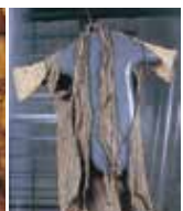
沖縄戦当時の住民の着物