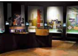
琉球処分から沖縄戦直前まで時系列に沿って展示

明治政府は、琉球王府に対して武力を背景にした『琉球処分』を断行した。そこで、沖縄県は皇民化政策によって急速に日本化を進めた。一方、近代化を急ぐ日本は、富国強兵策により軍備を拡張し、近隣諸国への侵出を企てた。満州事変、日中戦争、アジア・太平洋戦争へと拡大し、沖縄は、15年戦争の最後の決戦場となった。