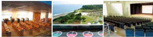
■情報ライブラリー (1階) ■展望室 ■平和祈念ホール (1階) 230名程度収容できます。

数多くの図書・雑誌を閲覧できるほか、AVブースでは戦争体験者の証言や平和に関するビデオ等もご覧になれます。また、中央の検索コーナーでは、パソコンの簡単な操作で資料館に収蔵されている多くの収蔵品や図書文献の情報、展示室の解説情報、平和学習の教材など、多様な情報を誰にでも簡単に手に入れることができます。