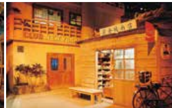
1960年代、ベトナム戦争の頃の基地の町並み、Aサインバーや当時の商店(マチャグラー)が再現されている。