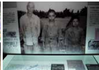
沖縄で捕虜となった防衛隊員と義勇隊員