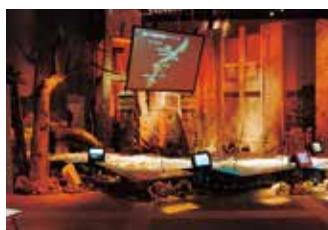
大型スクリーンに映し出される沖縄戦の様子